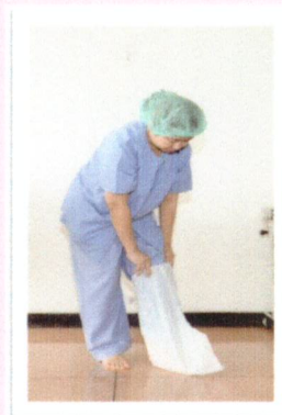
ใส่ถุงคลุมเท้า (leg cover)