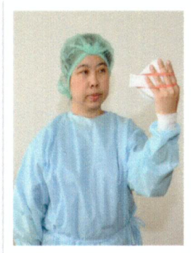
N - 95 (ทดสอบ Fit check)