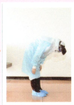
ทดสอบการ Fix ของ Face shield โดยการก้มหน้า