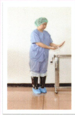
ใส่ถุงคลุมเท้า(Shoes cover) ล้างมือ