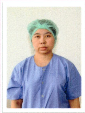
ใส่หมวกคลุมผมให้บริเวณมุม ไวที่หน้าผาก ครอบปิดหู 2 ข้าง