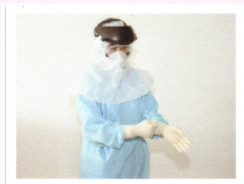
ใส่ถุงมือ 2 คู่