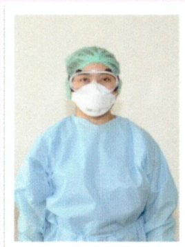
ใส่น้ำนตาหรือ Goggle