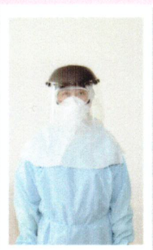
ใส่ Face shield