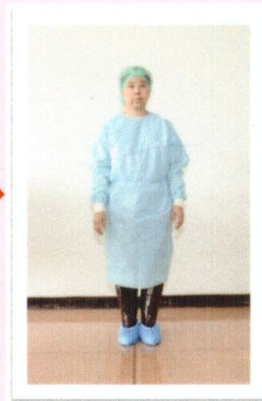
ใส่เสื้อกาวันกันน้ำแขนยาว