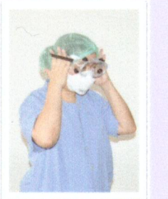
ถอดแว่นตาหรือ Goggle (ถอดในห้อง Anteroom)