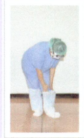
ถอดคลุมเท้า (leg cover) (ถอดในห้อง Anteroom)