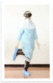
ถอดถุงสวมเท้า (Shoes cover) (ถอดในห้อง AIR)