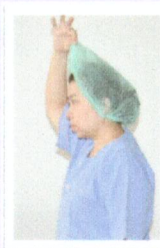
หมวกคลุมผม (ถอดในห้อง corridor)