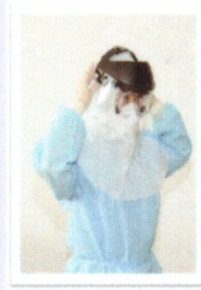
ถอด Face shield (ถอดในห้อง Anteroom)