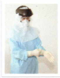
ถอดถุงมือชั้นนอก (ถอดในห้อง AIR)