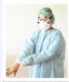
ถอด เสื้อกาวัน (ถอดในห้อง Anteroom)