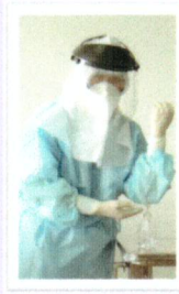
ล้างมือ (ล้างในห้อง Anteroom)