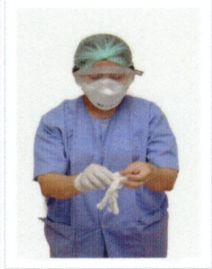
ใส่ถุงมือคู่มือใหม่ นำรองเท้าบูท รองเท้าฟองน้ำ แขนถึงน้ายาเข้าเชื้อ