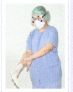
ถอด ถุงมือ (ถอดในห้อง Anteroom)