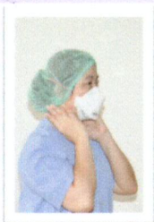
ถอด N - 95 (ถอดในห้อง corridor)