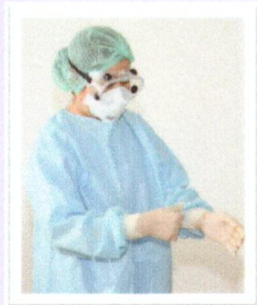
ถอดถุงมือชั้นใน (ถอดในห้อง Anteroom)