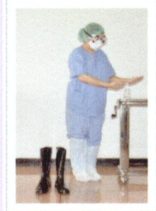
ถอดรองเท้าบูท/รองเท้าฟองน้ำ (ถอดในห้อง Anteroom) และล้างมือ