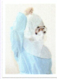
ถอด Hood (ถอดในห้อง Anteroom)