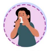
อาการกำเริบร่วมกับโรคมีไข้ได้ เช่น มีน้ำมูก คัดจมูก