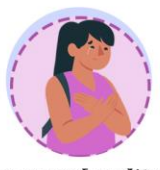
มีความแปรปรวนของโรค หากได้รับกระตุ้น ผู้ป่วยจะมีอาการเด่นชัด เช่น หลังดื่มน้ำเย็น อากาศเปลี่ยนแปลง ได้รับมลพิษทางอากาศ