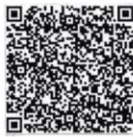
ตรวจสอบรายชื่อ