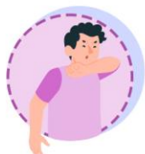
ไอเรื้อรัง ส่วนมากไอมีเสียง: