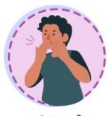
หายใจมีเสียงวี๊ด มักมีอาการมากในช่วงอากาศเย็น ตอนกลางคืน