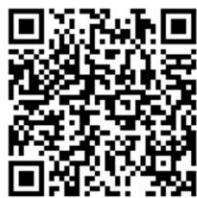
จำนวนผู้ประเมินสถานภาพ การจัดการพลังงานเบื้องต้น